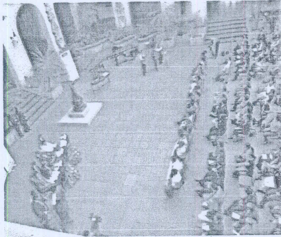
Cambio de la Rosa "Día Nacional de las niñas y niños víctimas del Conflicto Armado Interno COPREDEH-SEPAZ