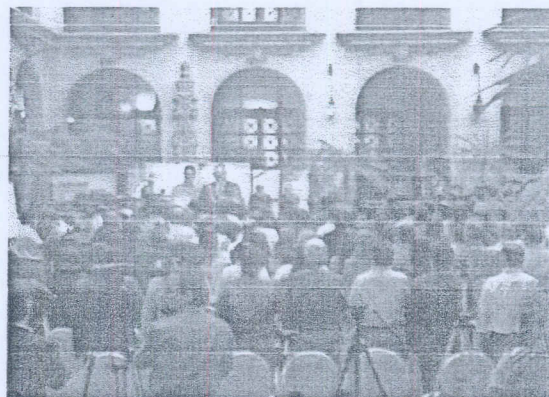
Actividad Entrega de Reconocimientos SEGEPLAN-INFOM